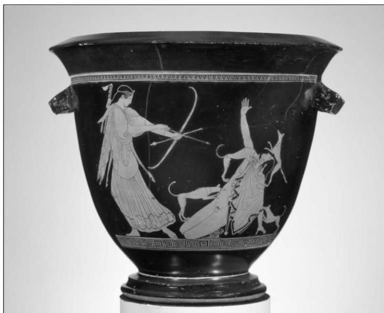
Artemisz és Aktaión egy ókori görög vázaképen (Aktaión egy vadász volt, aki megleste a fürdőző Artemiszt. Az istennő bosszúból szarvassá változtatta, saját kutyái tépték szét.)

A feladat az ókori görög hitvilággal kapcsolatos. Mutassa be a forrás és ismeretei segítségével az istenek jellemzőit, szerepét az ókori görög hitvilágban! (16 sor) 2017. május